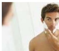
How Shaving Sharpens Your Life (Men's Life Today)