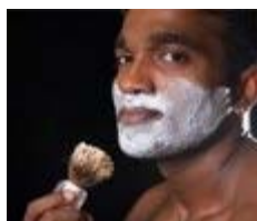
Don't Fear the Razor: Putting a Stop to Shaving Irritation (Men's Life Today)