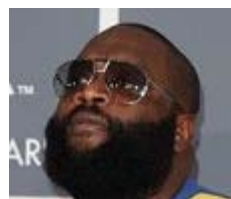
Coarse, Curly Facial Hair? These Beards Are For You (Men's Life Today)